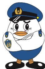
埼玉県警察マスコット 「ポッポくん」